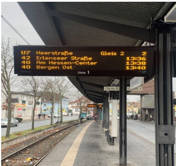
Anzeigetafel Enkheim

Mit dieser Maßnahme wird die Akzeptanz des ÖPNV gesteigert und die Attraktivität erhöht.