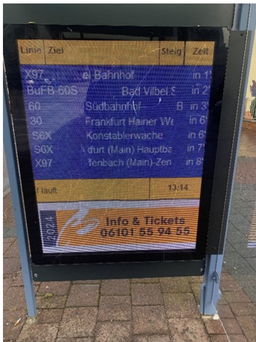
Anzeigetafel Bad Vilbel